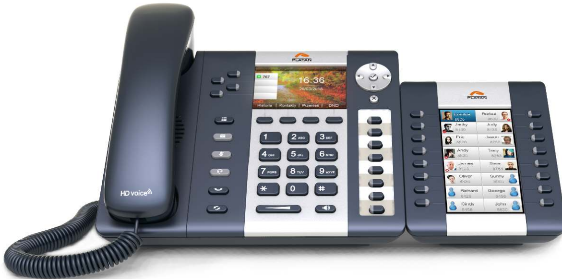
Konsola Platan EXT-244CG z telefonem Platan IP-T216CG